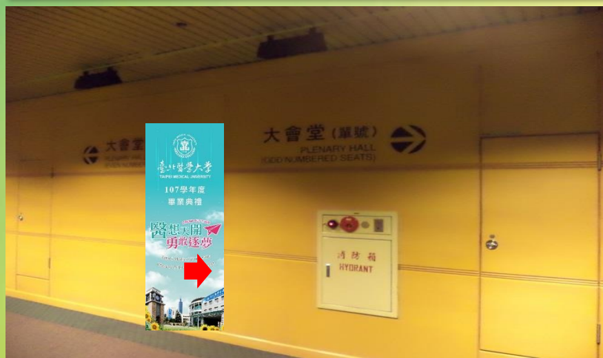
3. 依照入場指示入場