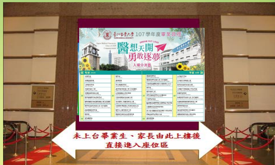
2. 依入場指示搭乘電扶梯至三或四樓