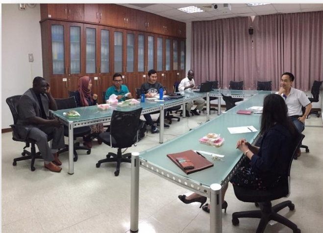
2018/11/21 與所內外籍生進行師生交流