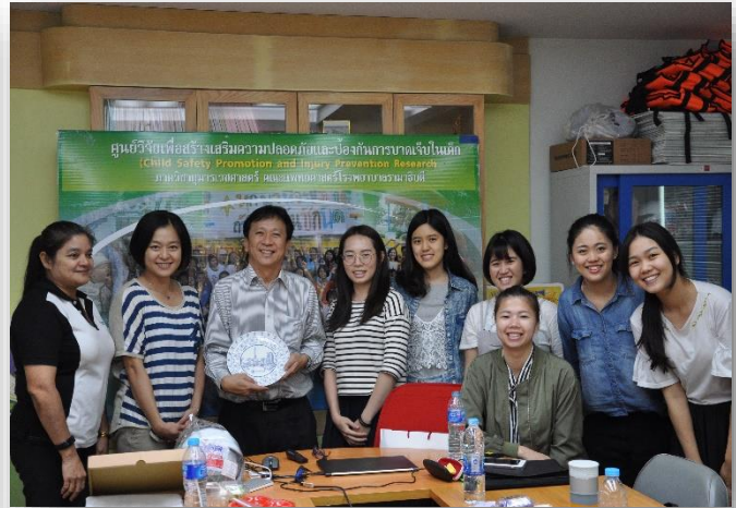
2017/12/02-16 學生至泰國 Mahidol University Child Injury Center 進行見習與學術交流