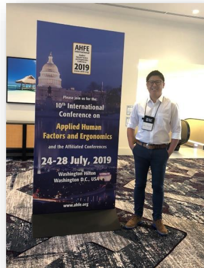
2018/7/24-28 學生至美國參與 10 th International conference on Applied Human Factors and Ergonomics 並發表研究成果