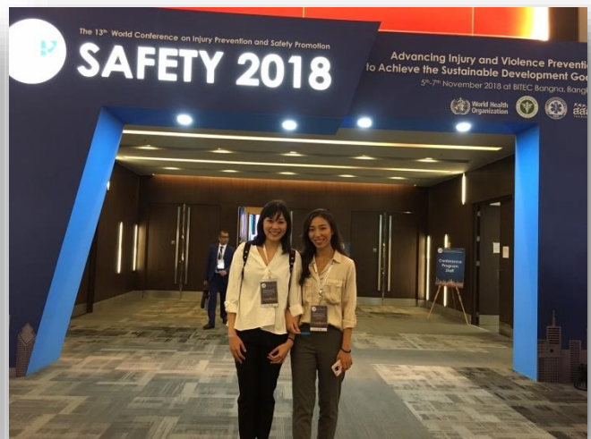
2018/11/5-7 傷防所學生至泰國參與 Safety 2018 Conference 並發表研究成果